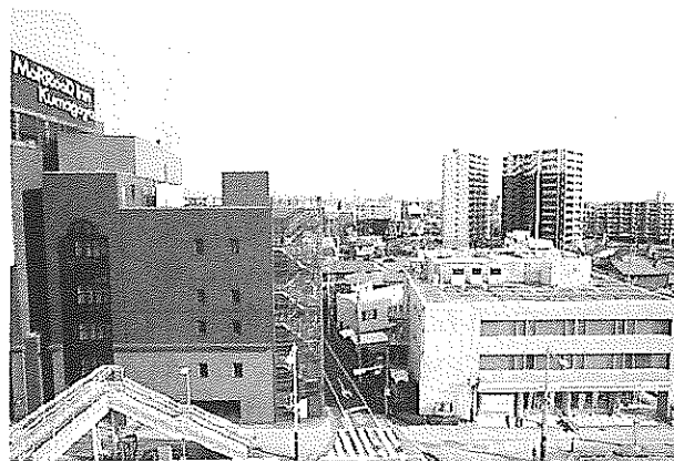
マロウドイン熊谷(左)と公道を挟んで隣接する熊谷支社(右)